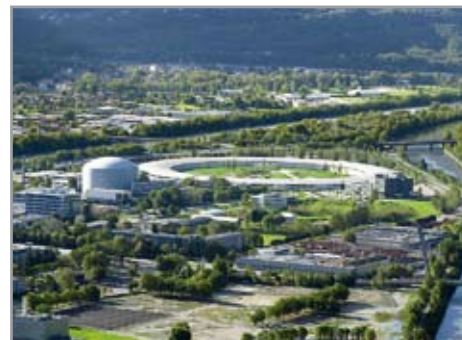
L'Institut Laue-Langevin près de Grenoble.